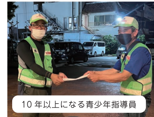
10年以上になる青少年指導員