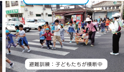
避難訓練：子どもたちが横断中