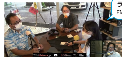
ラジオ番組「ホカクトワーズ」 FMコザ 76.1MHz 月：18時～19時

「保守・革新を超えて沖縄市をもっと良くしていく」というコンセプトのもと、番組MCを保守系議員と革新系のなおやが務めています。