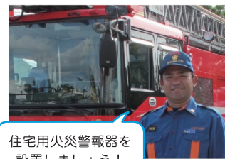
住宅用火災警報器を設置しましょう！

学校・地域の避難訓練援助、心肺蘇生、AED 救命処置訓練、消火訓練、防火啓発、津波警戒、台風時災害援助活動など、地域防災組織、消防団で活動。