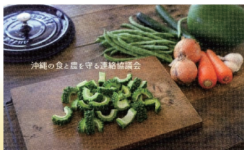
沖縄の食と農を守る連絡協議会