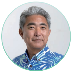
前衆議院議員 屋良 朝博