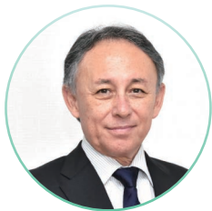
沖縄県知事 玉城 デニー