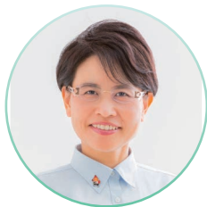
沖縄県議会議員 仲村 未央